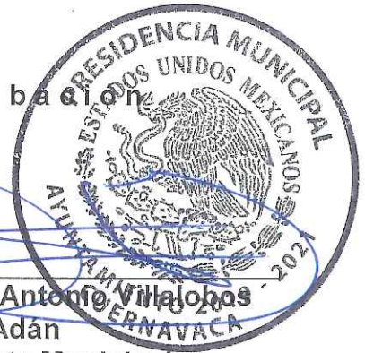
Lic. Francisco Antonio Villalobos Adán Presidente Municipal Constitucional

El presente Programa Presupuestario, se formuló con fundamento en Artículo 134 de la Constitución Política de los Estados Unidos Mexicanos, el artículo 81 de la Constitución Política del Estado Libre y Soberano de Morelos, los artículos 54 y 61 fracción II inciso a), b) y c) del título quinto de la Ley General de Contabilidad Gubernamental, los artículos 26, 33 y 34 de la Ley Estatal de Planeación; artículos 23 y 25 de la Ley de Presupuesto, Contabilidad y Gasto Público del Estado de Morelos, y artículos 49, 54, 55 y 57 de la Ley Orgánica Municipal del Estado de Morelos.